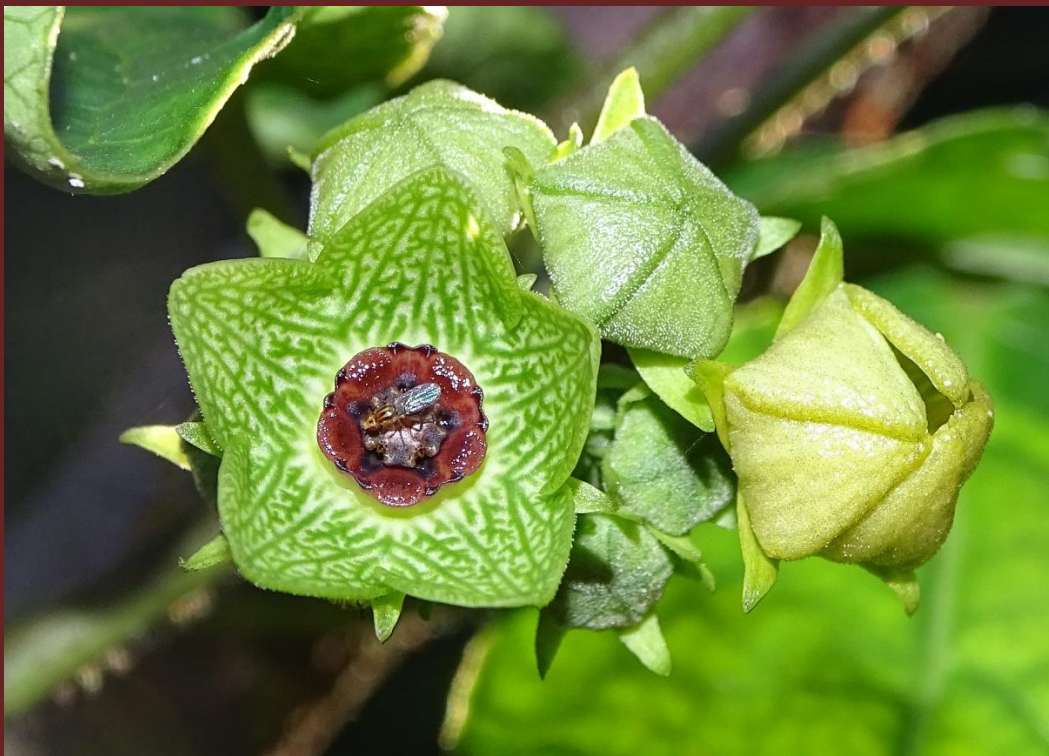
Matelea balansae Morillo & Fontella (2012)