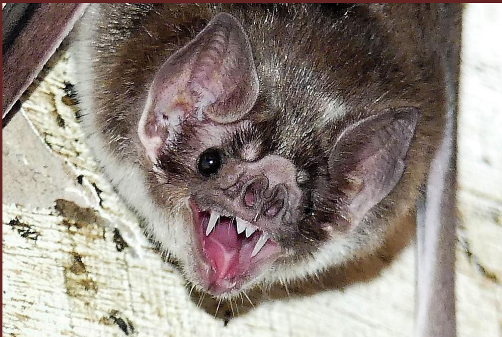
Desmodus rotundus (E.Geoffroy, 1810)